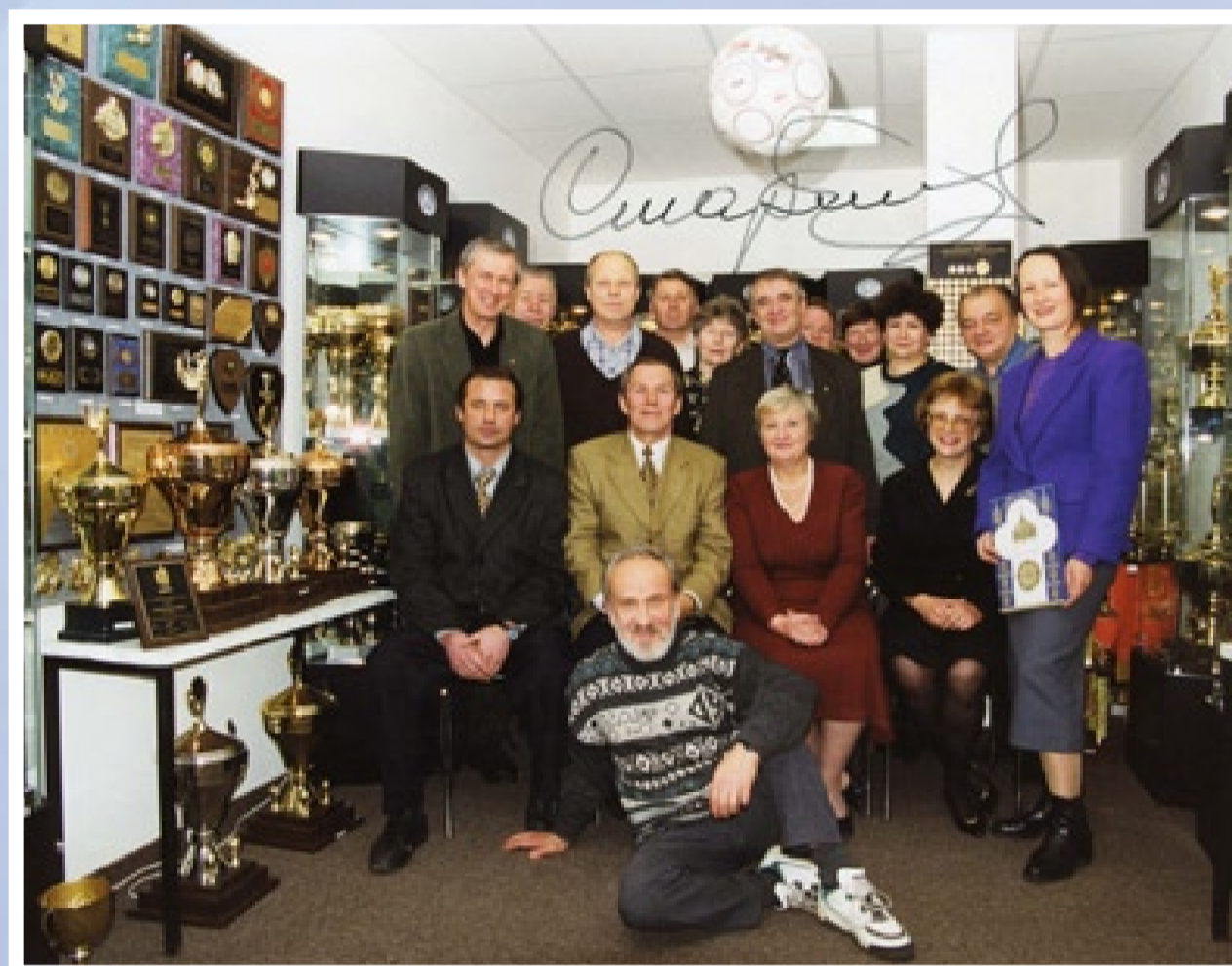
... двукратный олимпийский чемпион по хоккею Вячеслав Иванович Старшинов, ...