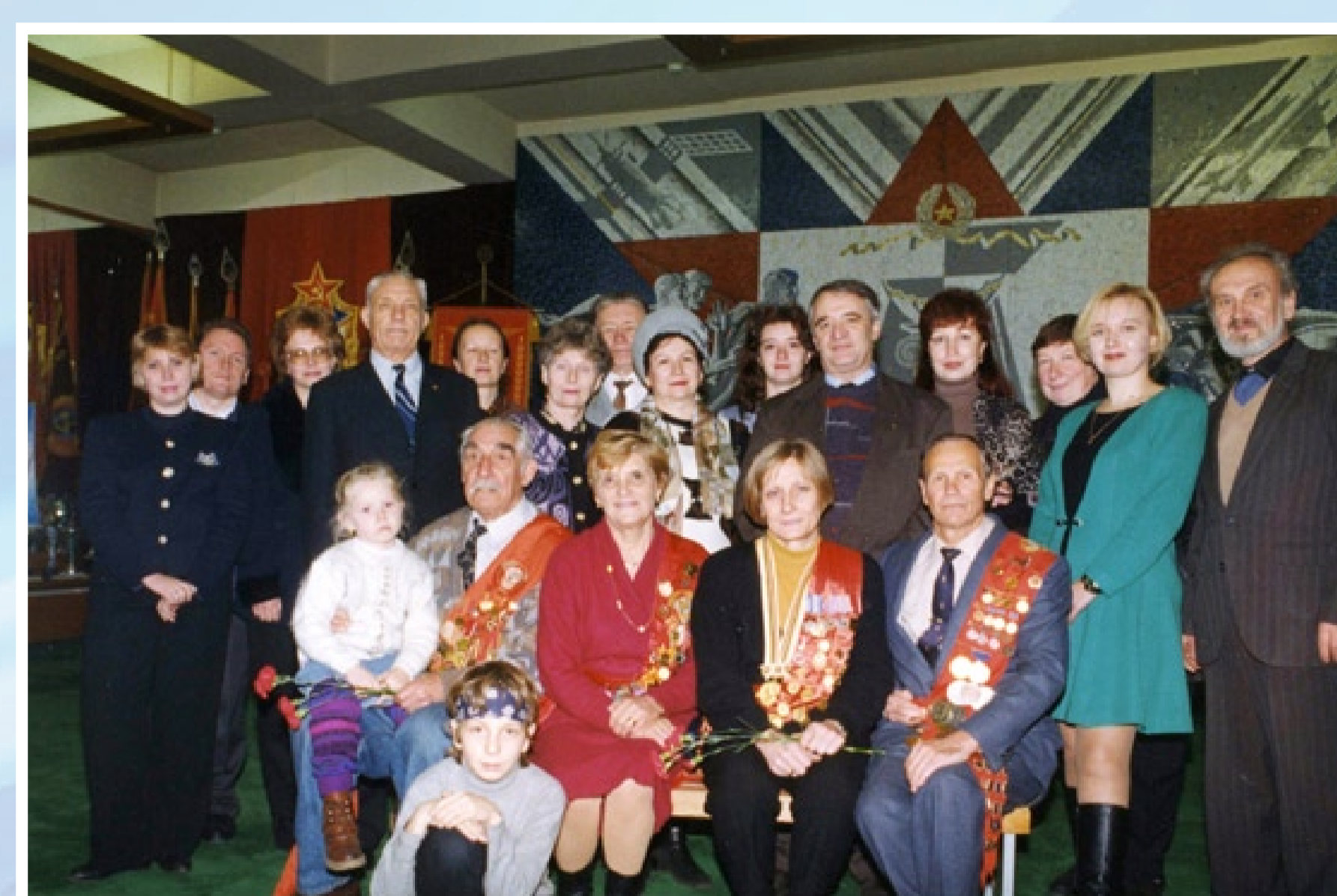
В Музее спортивной славы ЦСКА. Ветераны армейского спорта и сотрудники «Диалога-Конверсии»