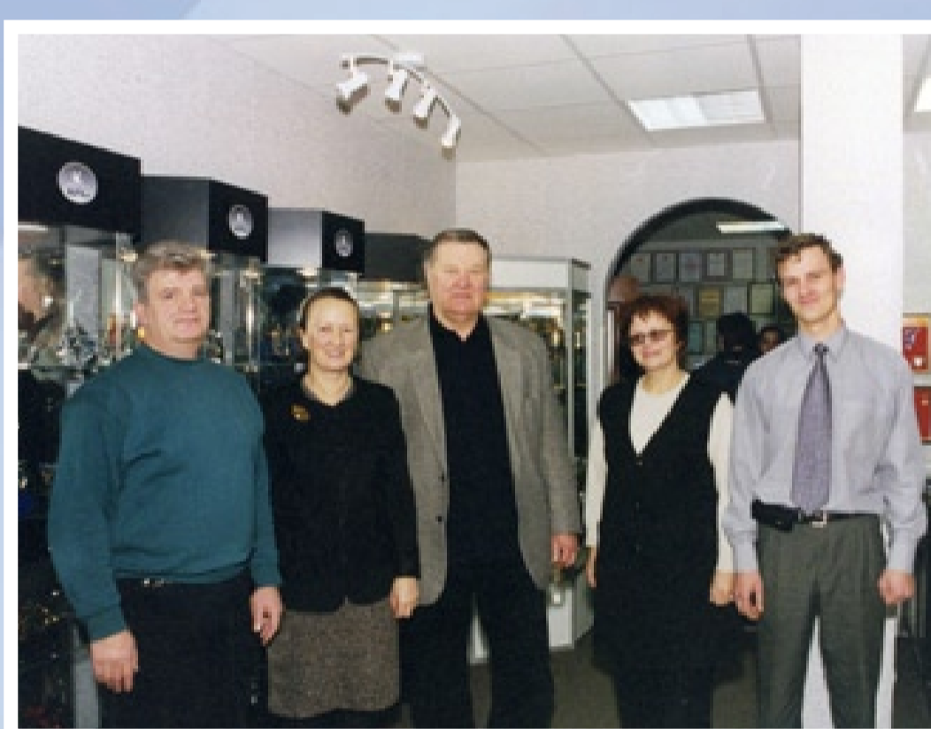
... двукратный олимпийский чемпион по тяжёлой атлетике Леонид Иванович Жаботинский, ...