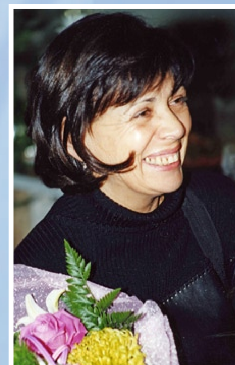
... трёхкратная олимпийская чемпионка по фигурному катанию Ирина Константиновна Роднина, ...