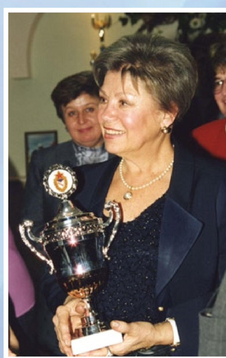
... девятикратная олимпийская чемпионка по спортивной гимнастике Лариса Семёновна Латынина, ...