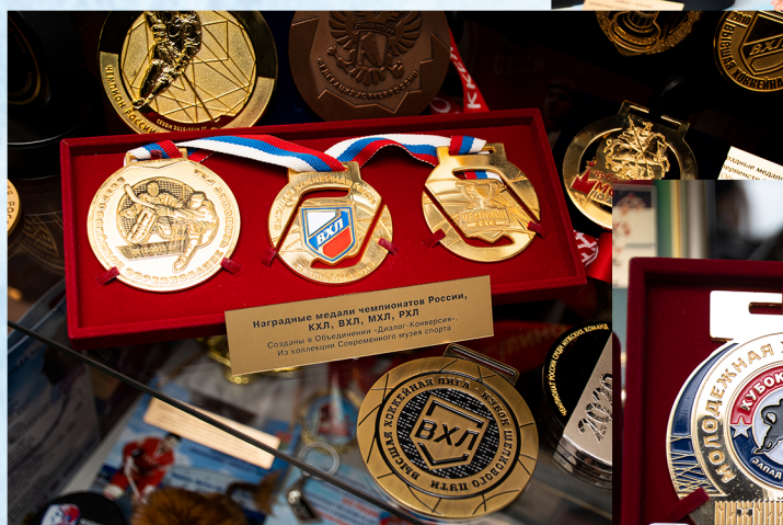
Наградные медали чемпионатов России, КХЛ, ВХЛ, МХЛ, РХЛ Созданы в Общественном центре «Динамо» - Конверсия Из коллекции Современного музея спорта