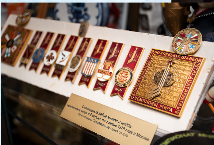
Сувенирный набор эмблем и шайбы чемпионов мира и Европы по хоккею 1979 года в Москве Из коллекции Современного музея спорта